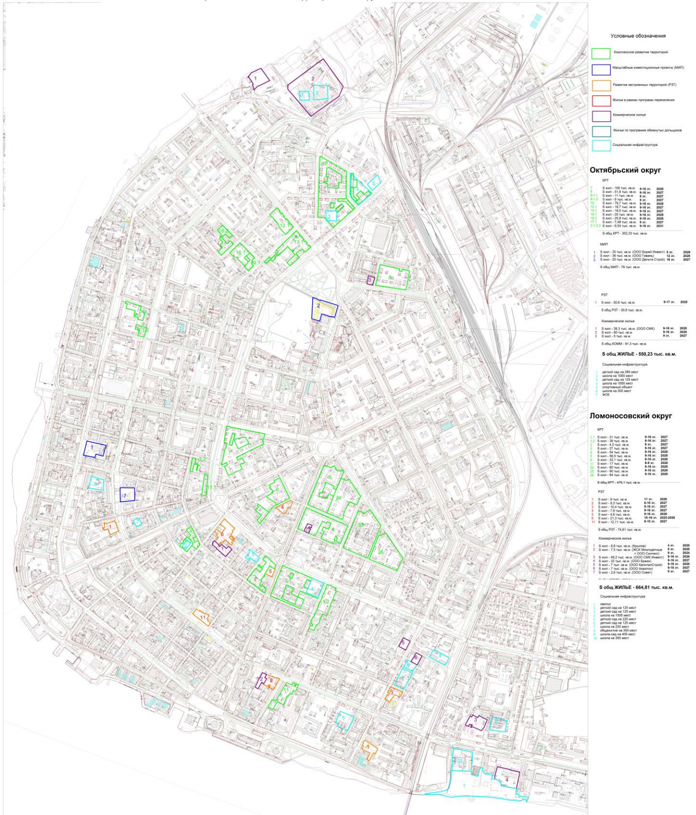
Рисунок 8.3 Участки перспективной застройки в округах Октябрьский и Ломоносовский